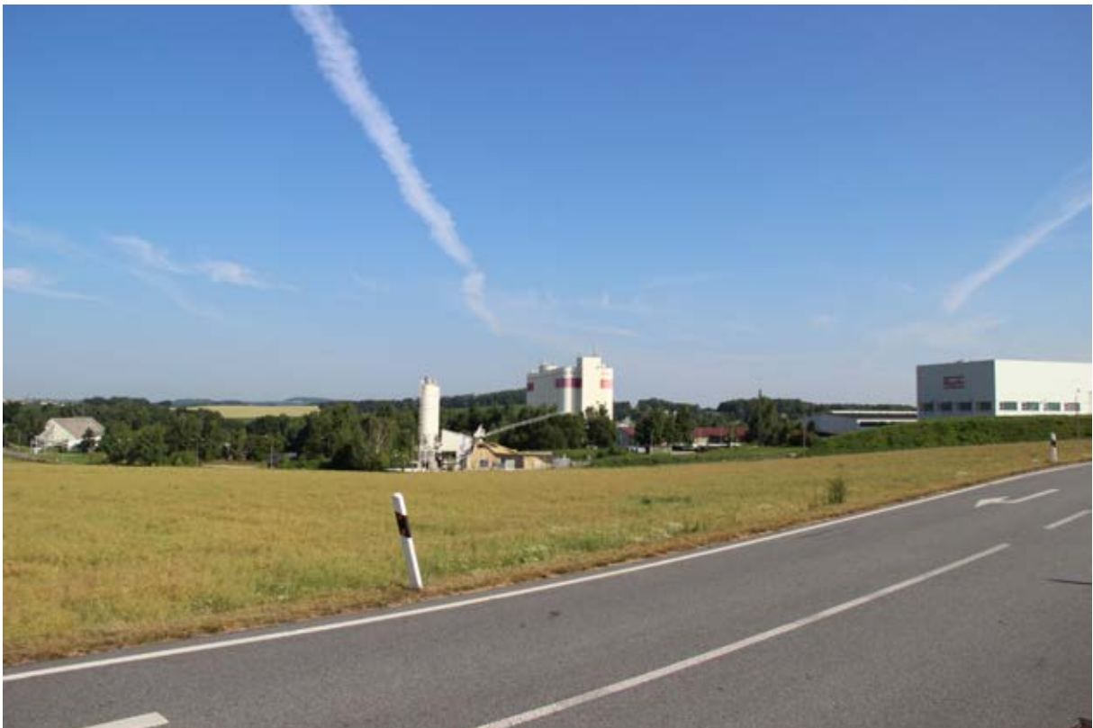
Sommerlicher Blick von der B 98 auf die Agrofert.