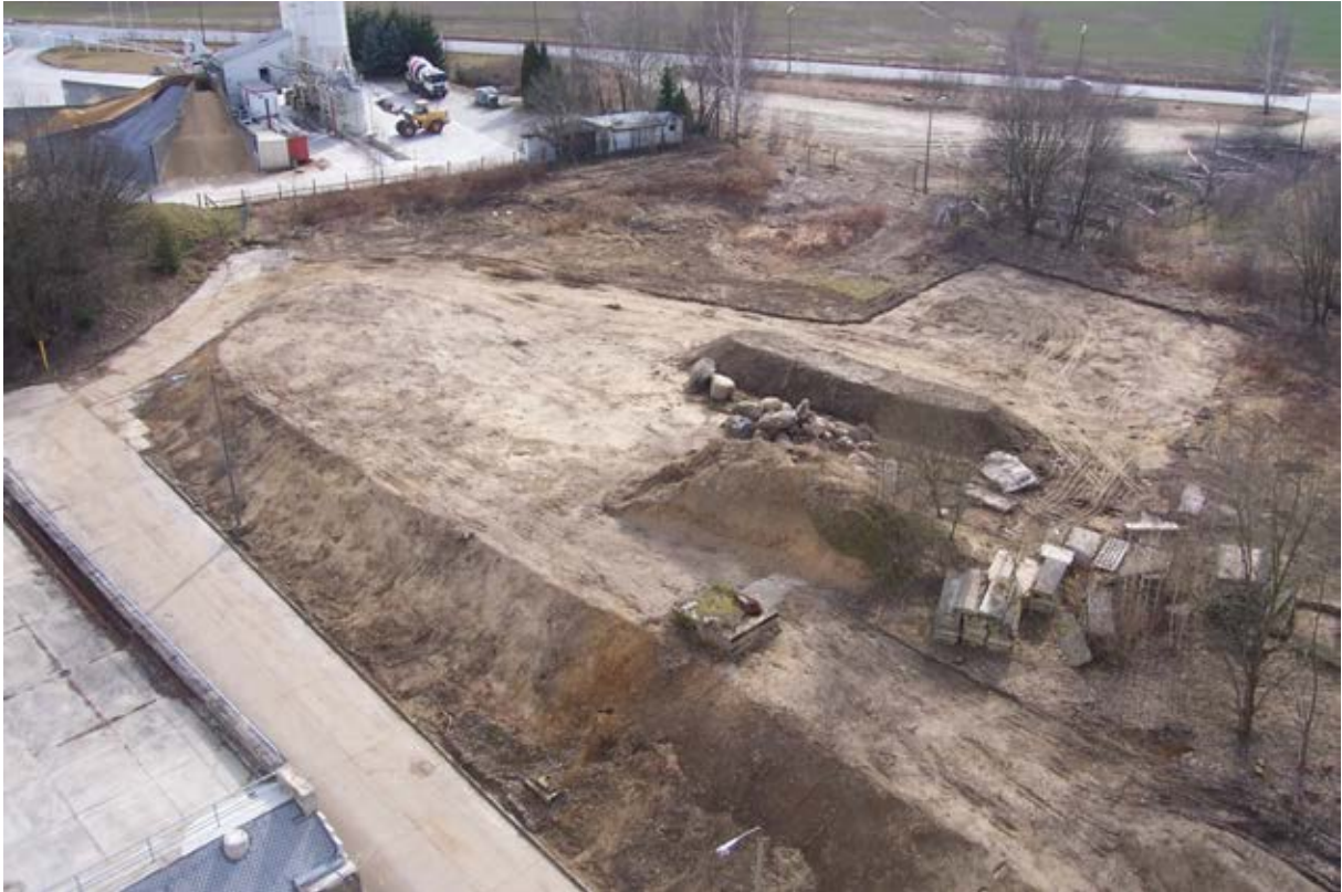
Blick vom Hochsilo auf das größtenteils beräumte Baufeld.