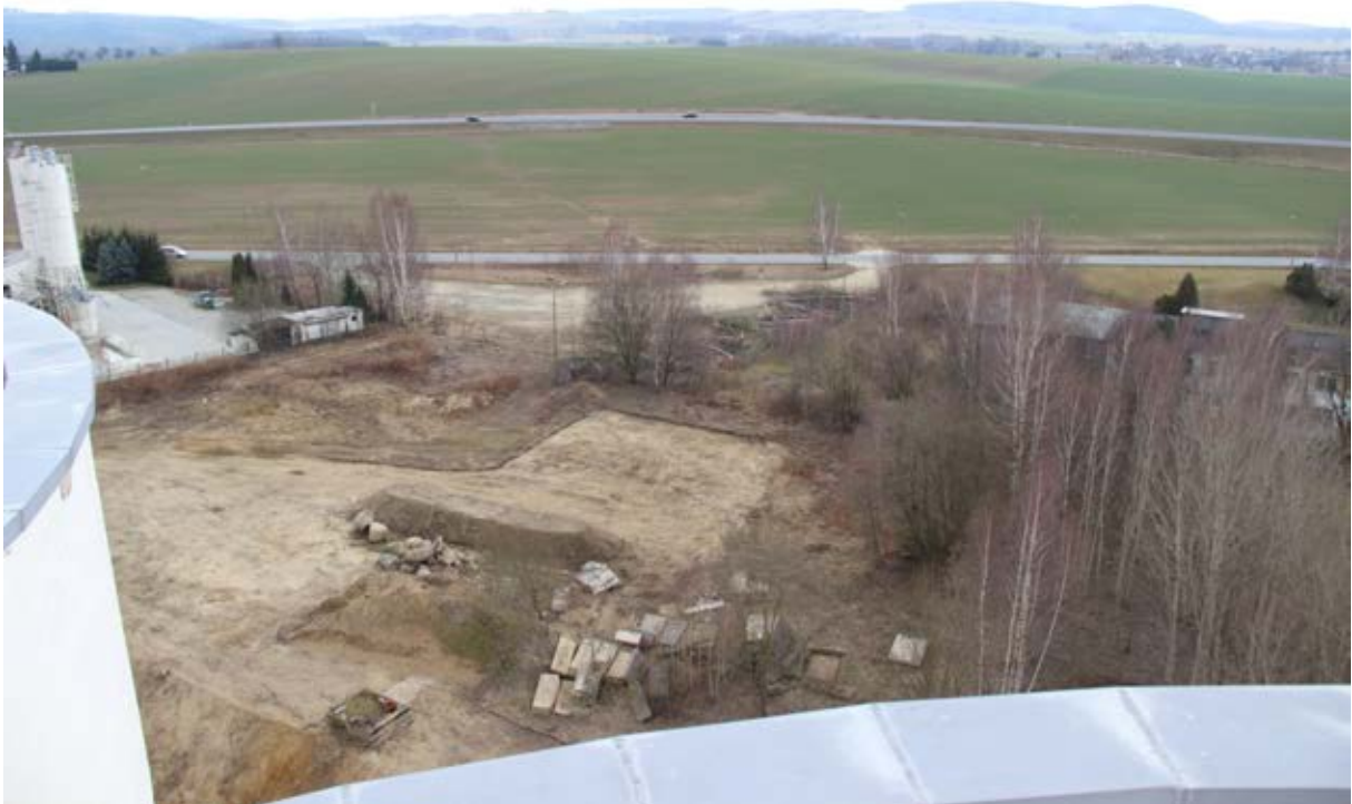
Hier wird die neue Zufahrt zur Agrofert gebaut. Im Hintergrund die Bundesstrasse 98 mit direktem Anschluss an die Agrofert. Die Autobahn 4 (Dresden-Polen) liegt nur wenige Kilometer entfernt. Eine ideale Verkehrsanbindung!