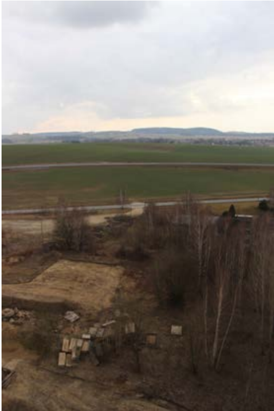
Zwischen den Bäumen wird die neue Zufahrt entlang gehen.