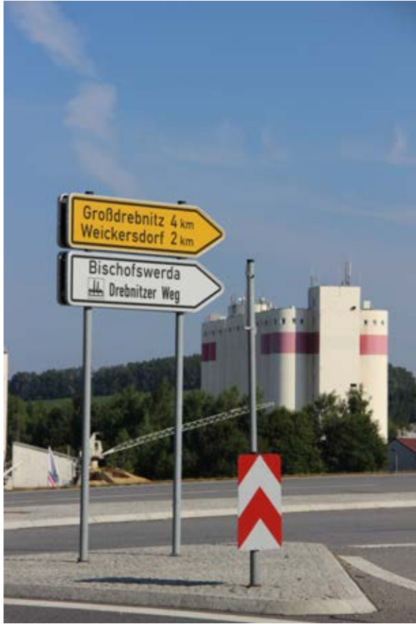
Blick von der Ausfahrt der B 98 auf die Agrofert.